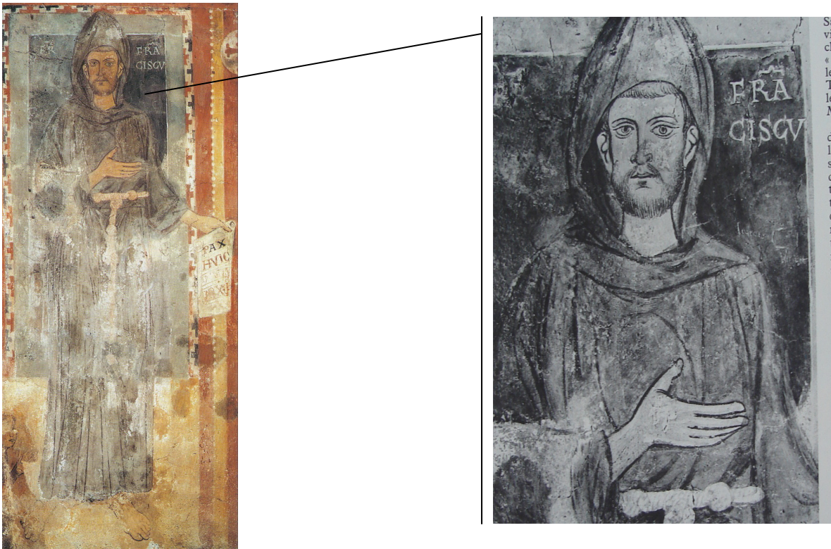
Figura 1 Autor desconhecido. Frater Franciscus , c.1228. Afresco, sem informações sobre as dimensões. Capela de São Gregório do Sacro Speco , monastério beneditino de Subiaco, Itália.

iconografia do fundador da sua Ordem (DUBY, 1997: 90). Contudo, a primeira imagem evocando o modelo pictórico de Francisco que se tem notícia, foi pintada em 1228, pouco antes da sua canonização, na parede da capela de São Gregório do Sacro Speco - monastério beneditino de Subiaco (VORREUX, 1980: 228). Nela, Francisco aparece representado sem auréola e no alto, à esquerda, encontramos uma inscrição latina na qual se lê Frater , e não Sanctu . Este fato comprova que ele já era representado naquele momento, antes de sua canonização e até mesmo fora da comunidade franciscana.